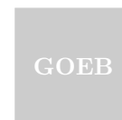
Gebruiksoppervlakte Externe Bergruimte